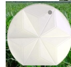
Tapa para depósito